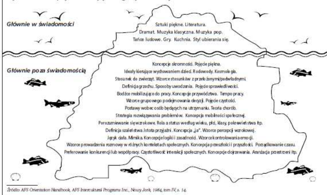
Rys. 1: Koncepcja kultury jako góry lodowej